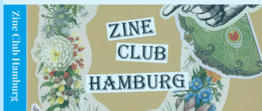
Zine Club Hamburg